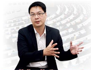
ถอดรหัสร้อนจับชีพจรการเมือง