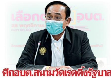
ศึกอบต.สนามวัดเรตตั้งรัฐบาล

ต้องจับตาม ศึก อบต. สนามแรก ที่จะเป็นตัววัดพลังของแต่ละพรรคการเมือง ที่จะเข้าสู่สนามใหญ่ต่อไป เพราะถ้า รัฐบาลเรตตั้งดีการ “ยุบสภา” อาจมาเร็วกว่าที่คิด