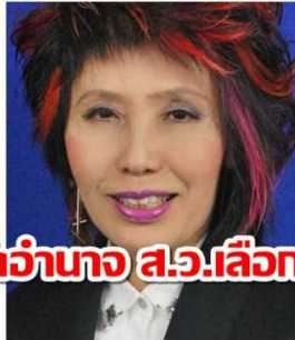
หนุนตัดอำนาจ ส.ว. เลื่อนนายกฯ

"หมอพรทิพย์"ประกาศชัด! หนุนตัดอำนาจ ส.ว. เลื่อนนายกฯ