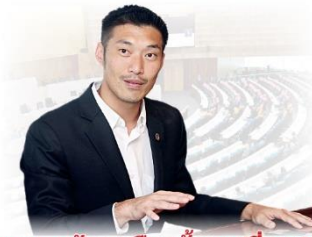
‘ธนาธร’ ปักธงเลือกตั้งลุยเปลี่ยนปท.

‘สุดท้ายคดีมันเป็นเพราะผมเป็นอาชญากรโดยสันดาน หรือเป็นเพราะคดีการเมือง ที่ผมมีจุดยืนทางการเมืองของผม ลองไปถามคนในแวดวงธุรกิจคนไหนก็ได้ที่เคยทำธุรกิจกับผม ว่า ธนาธรเป็นคนอย่างไร’