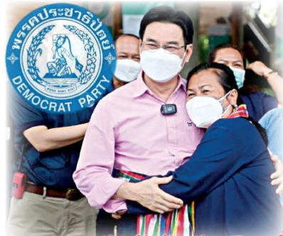
ตลาดส.ส.คึกคักรับศึกเลือกตั้ง

ต้องรอดูเงื่อนไขกติกาใหม่ ลุ้นกันเป็นขยักๆ “ใหม่ไลน์เลือกตั้ง”ทางการ ต้องรอรัฐธรรมนูญฉบับแก้ไขประกาศใช้ และเวลาร่างกฎหมายลูกบัตรเลือกตั้ง 2 ใบ ท้ายที่สุดจะออกมาเป็นแบบไหน