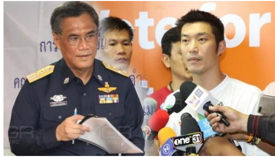
นายอิทธิพร บุญประคอง ประธาน กต. - นายธนาธร จึงรุ่งเรืองกิจ หัวหน้าพรรคอนาคตใหม่

เผยแพร่: 5 ธ.ค. 2562 12:41 | ปรับปรุง: 5 ธ.ค. 2562 14:26 | โดย: ผู้จัดการออนไลน์