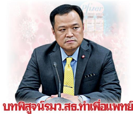
บทพิสูจน์ร.ม.ส.ร.ทำเพื่อแพทย์

มาตรการที่สองคือมาตรการด้านวัคซีน ที่แพทย์ บุคลากรด้านหน้าทางสาธารณสุข ประชาชน ให้ความมั่นใจกับ วัคซีน mRNA หรือวัคซีนตัดต่อพันธุกรรมอย่างไฟเซอร์ โมเดอน่า มากกว่าวัคซีนเชื้อตายที่รัฐบาลตะบี้ตะบันสั่งไม่หยุดอย่างซิโนแวค ซึ่งรัฐบาลเขาก็บอกว่าเร่งดำเนินการให้อยู่ ได้ในไตรมาสสี่ ซึ่งก็ไม่รู้ต้น ต.ค.หรือปลาย ธ.ค.ลุ่นเอา