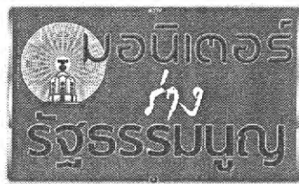
สำนักข่าวเนชั่น

การร่างรัฐธรรมนูญเข้มข้นทุกขณะ โดยขณะนี้กำลังก้าวเข้าสู่เรื่องการจะหาข้อยุติว่า “นายกรัฐมนตรี” จำเป็นต้องมาจากผู้ที่เป็น ส.ส.หรือไม่ เรื่องนี้หากย้อนสถานการณ์กลับไป จะเห็นได้ว่า สังคมไทยเคยเรียกเรื่องนี้นามาแล้วเมื่อปี 2535 ช่วงเหตุการณ์พฤษภาทมิฬ ซึ่งเป็นช่วงหลังการรัฐประหาร และที่เราเรียกเรื่องเช่นนั้น เพราะไม่ต้องการให้คณะรัฐประหารสืบทอดอำนาจและกลับเข้าสู่กระบวนการปกติ และเห็นพ้องว่า ผู้ที่จะมาเป็นผู้นำของประเทศควรมาจากการเลือกตั้ง สุดท้ายรัฐธรรมนูญปี 2540 จึงยอมบัญญัติตาม และรัฐธรรมนูญ 2550 ก็บัญญัติด้วยข้อความเช่นว่าเหมือนกัน