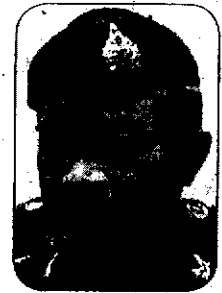
พล.อ.เดลินิวส์ สิทธิสาท

ไม่รู้เป็นสูตรของ “รบพิเศษ” ที่ใช้แนวทาง “พลังเงียบเนียนขาด” ไร้ร่องรอยหรือเปล่า จึงมักล่องหนไปทุกที่แบบไม่มีใครเห็นเงา!!!