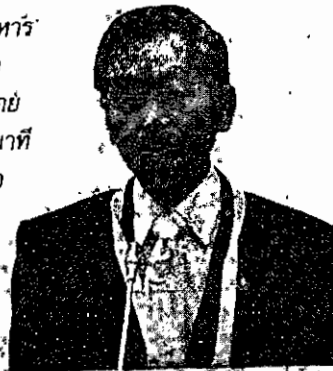
นายชวน หลีกภัย ประธานรัฐสภา

“แต่ละฝ่ายจะบริหาร เวลาตัวเอง ซึ่งที่ผ่านมา ควบคุมเวลาได้ดี ยกปราย คนละ 2 นาที หรือ 5 นาที โดยไม่ต้องเตือนกัน เมื่อ ก่อนตอรองกันมาก ดังนั้น เมื่อจบก็ขอ ให้จบ ไม่เช่นนั้นทุก คนจะรู้สึกว่าคุณ เหมือนเด็กเล่น”