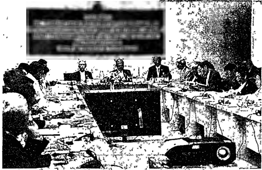
ต.ว. ส.ว. - สำนักงานเลขาธิการวุฒิสภาจัดสัมมนาสมาชิกวุฒิสภา (ส.ว.) เตรียมความพร้อมต่อการแถลงนโยบายของรัฐบาล ระหว่างวันที่ 25-26 กรกฎาคมนี้ ที่อาคารรัฐประเพณี ถนนประชาธิปไตย กรุงเทพมหานคร เมื่อวันที่ 22 กรกฎาคม