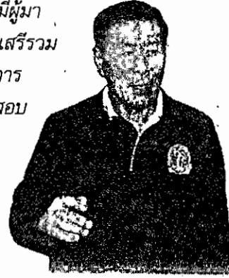
พล.ต.อ.เสรีพิศุทธ์ เตมียเวส หัวหน้าพรรคเสรีรวมไทย

"ก่อนการเลือกตั้งมีผู้มาสมัครลงเป็น ส.ส.พรรคเสรีรวมไทยกว่า 2-3 พันคน มีการตั้งคณะกรรมการตรวจสอบประวัติ แต่ไม่ได้สอบลึกมาก สอบแค่คุณสมบัติ ผู้สมัคร ส.ส.เบื้องต้นไม่ได้สอบถึงประวัติ อาชญากรรมที่เคยทำผิดกฎหมายได้"