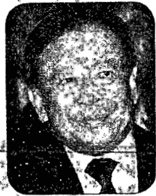
พ.ต.อ.จรงค์วิทย์ ภูมิมา

คลอด...● พ.ต.อ.จรงค์วิทย์ ภูมิมา เลขาธิการ กกต.นั่งย่นย่นย่นว่าโรคเลื่อนเป็นแค่เสียงลือเสียงเล่าอ้าง เพราะหากมีการประกาศ พ.ร.ก.เลือกตั้งปี กกต.จะประชุมทันทีหลังประกาศภายใน 5 วัน ซึ่งหมายความว่า ภายในวันที่ 7 ม.ค.จะเคาะวันเลือกตั้งออกมาได้...● หากไม่มีอะไรเปลี่ยนแปลง 24 ก.พ.ผู้มีสิทธิเลือกตั้งทุกคนก็ต้องทำตัวให้ว่างแล้วเข้าคูหา ฉะนั้นเสียงนกเสียงกาวันนี้ที่ฟุ้งงอแงเรื่อง แม้แต่เรื่องยุกยิกตุ๊กตักในมุ้งในโรงแรม เข้ากับการเลื่อนเลือกตั้ง ก็ปล่อยๆ เขาไปนะ...● แต่ประเด็น “บัตรเลือกตั้ง” ต่างหากที่จะส่งผลกระทบต่อกับวันเลือกตั้ง เพราะถ้าหากทุกพรรคการเมืองยืนยันให้เป็นแบบเบอร์เดียวทั่วประเทศ ก็หมายถึงต้องมีการแก้กฎหมาย ซึ่งกระบวนการไม่ยาว แต่ขั้นตอนที่เกี่ยวข้องอาจยาวกว่าว่วนั้นเอง... ฉะนั้นคำตอบก็อยู่กับบรรดานักเล่นการเมืองนั้นแหละว่าจะเตะหุ้มเข้าปากหมา ถอยหลังกลับไปเริ่มต้นนับหนึ่งใหม่หรือเปล่า...● ปัญหาการบ้านจะกลายเป็นการเมืองหรือเปล่านั้น มีให้ลุ้นตั้งแต่ต้นปีเลยทีเดียว กับมทกรมการลารายชื่อถอดถอน ป.ป.ช.ที่ปล่อย “บิกบ้อมกับนาฬิกา” ให้ลอยนวล ..เพราะวันนี้เห็นแค่บทความของบรรดาครูบาอาจารย์สอนกฎหมายอภิปรายเรื่องคำวินิจฉัยของ ป.ป.ช.ก็รู้สึกหนาวๆ ร้อนๆ แทน...● บันทึกบรรทัดส่งท้ายปีเก่า..หากถือคติ “ชีวิตที่ไม่ได้ทำอะไรคิด” แปลว่ามองอะไรทำไม่ได้คิดทำอะไรเลย ดังนั้น “คนที่ทำผิด” ก็สะท้อนบอกว่า อย่างน้อยที่สุด เขาได้พยายามทำหรือลงมือปฏิบัติ ไม่ใช่ดีแต่พูด เอาดีใส่ตัวแล้วเพ่งโทษคนอื่นอย่างเดียว..จริงไหม???...●