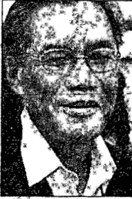
อิทธิพร บุญประคอง

■...เก็บตกวันหยุดยาวเทศกาลปีใหม่ที่ซึ่งเป็นช่วงเวลาที่คนส่วนใหญ่วางแผนเดินทางไปท่องเที่ยวพักผ่อนหย่อนใจ แต่ไม่ใช่ประธาน กกต. "อิทธิพร บุญประคอง" ก็เพราะเจ้าตัวกระซิบบอกกระจอกข่าวสาวสวยว่า คงไม่ไปไหนไกล แต่คงมาทำบุญวัดใกล้บ้าน เพื่อความเป็นสิริมงคลกันถ้วนหน้ากับทุกคนในครอบครัว เพราะกกต.มีงานเยอะ!!!... "ซึ่งถ้าดูจากสัปดาห์ก่อนพูดแล้วน่าจะอ้างถึงเยอะกว่านี้ด้วย" สำหรับบรรพชนของทั้งนี้ประธาน กกต.นั้น ชอบการอ่านหนังสือ และวิ่งออกกำลังกายเช้า-เย็น...พร้อมกับ ยกตัวอย่างตอนที่เกษียณจากตำแหน่งเอกอัครราชทูตประจำกรุงเฮก ประเทศเนเธอร์แลนด์ แล้ว ก่อนที่จะมารับทำงานหน้าที่ประธาน กกต. เจ้าตัวบอกว่า อ่านหนังสือหมดไปหลายเล่มมาก โดยเฉพาะหนังสือที่ตีพิมพ์เป็นภาษาอังกฤษ ...เพราะไม่ยากให้การใช้ภาษาอังกฤษลดน้อยลงไปก็เลยเลือกอ่านหนังสือประเภท non fiction ภาษาอังกฤษประมาณ 50-60 เล่ม ซึ่งบางเล่มก็สนุกจนต้องอ่านซ้ำ... "เล่มที่ชื่นชอบมาก ซึ่งได้อ่านช่วงใกล้จะมาเป็นกกต.พอดี หนังสือเล่มนี้ชื่อ RISE and KILL FIRST แต่งโดย Ronen Bergman มีเนื้อหากการต่อสู้ของชาวอิสราเอล แม้ผมจะไม่เห็นด้วยกับวิธีการแก้ปัญหาที่เขาทำผู้คน แต่ผมก็เห็นใจที่เขาทำอย่างนั้น หนังสือเล่มนี้หนาๆ แต่การเดินทางเรื่องก็สนุกจนวางไม่ลง และมีหน้าที่ต้องอ่านซ้ำ โดยอ่านจาก E-Book หนังสือเรื่องนี้สนุกมากผมการันตี..."...เอา...หนอนหนังสือสนใจ ก็ลองไปหามาอ่านกันบ้าง ประธาน กกต.การันตี สนุกจนวางไม่ลง และต้องวนกลับมาอ่านซ้ำนะครั้บ...■