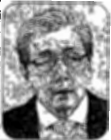
ดร.สมคิด จาตุศรีพิทักษ์

W ww.thaipost.net ไทยโพสต์ “อิสรภาพแห่งความคิด” Line ID:@thaipost บันทึกวันสิ้นปีเก่า 2561 ต้อนรับปีใหม่ 2562 ..ถึงแม้เส้นทางชีวิตจะไม่หมู แต่ตื่นขึ้นมาในปีใหม่ ..ตั้งแต่วันพรุ่งนี้! ขอให้เรื่องต่างๆ กลายเป็นเรื่องหมูๆ เรื่องร้ายกลายเป็นเรื่องดี เรื่องหนักอ่อนคลายกลายเป็นเรื่องเบา...● ที่แน่ๆ เขาด้วยกันอย่างแน่นอนกับวันหยุดยาวหลังจากจับจ่ายใช้สอยฉลองเทศกาล แม้แต่เงินคงคลังของรัฐบาลดูเหมือนจะ “เบาหวิว” ด้วยเจตนาที่ระบุว่า เพื่อเป็นของขวัญปีใหม่ให้กับประชาชน ไม่เกี่ยวไม่เกี่ยวกับยุทธศาสตร์การหาเสียง...● ใครเชื่อกี่เชื่อกันไป ว่าผู้ใหญ่ คสช.ใจดีใจดี แต่ขอเตือนว่า คนมีสิทธิเลือกตั้งส่วนใหญ่ เขาไม่เชื่อกันหรอกนะ เพราะแต่ละก้อนที่แจกจ่ายออกไปช่วงสงกรานต์ปีหมา ไม่ว่าจะเงิน 500 บาทที่ให้แบบครั้งเดียวกับผู้ถือบัตรคนจน ทั้ง 14.5 ล้านคน หรือเงินค่าเดินทางไปรับการรักษาพยาบาล และค่าใช้จ่ายอื่นเกี่ยวกับสุขภาพสำหรับผู้สูงอายุที่มีรายได้น้อย อายุตั้งแต่ 65 ปีขึ้นไป คนละ 1,000 บาท แบบให้ครั้งเดียวจำนวน 3.5 ล้านคน แต่ต้องใช้สิทธิ์ระหว่างเดือน