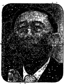
มิ่งขวัญแสงสุวรรณ

ธ.ค.2561 ถึงเดือน ก.ย.2562 ..มันบ่งชี้ว่าเกือบปี “ประชานิยมสุดโต่ง” แบบไม่ใช่แต่ก็ใกล้เคียงทีเดียวเชียวนะ...● ว่าแต่เขาโอเหนาเป็นเอง...ของแท้หรือของเทียม ดร.สมคิด จาตุศรีพิทักษ์ ในฐานะหัวหน้าทีมเศรษฐกิจรัฐอยู่แะใจ เพราะประชารัฐหรือประชานิยมมันก็ทำให้เกิดปัญหาวิญญูการคลังไม่แพ้กัน ปัญหาขอติดตามไปดูสักหน่อยว่า “พรรคเศรษฐกิจใหม่” โดยมีมิ่งขวัญ แสงสุวรรณ จะมึวิธีจัดการบริหารความเหลื่อมล้ำทางเศรษฐกิจแบบลดแลกแจกแถมที่สังคมไทยเคยชินกันมานานับศวรรษให้ฉีกออกไปหรือเปล่า!!!!● เพราะมองไปทางซ้ายพรรคการเมืองใหม่ๆ ก็อดอ้างหาเสียงว่า คนจนจะหมดประเทศ มองไปทางขวาพรรคเก่า แก่แต่โบราณก็คุยว่า คนไทยจะรวยขึ้นๆ ..สาธุ 3 Times...● แต่ก่อนจะถึงวันชี้ชะตาใครจะมาแก้โจทย์เศรษฐกิจชาติในอนาคตอันใกล้ คงต้องจับยามสามาดาลูกกันก่อนว่า จะเกิด “โรคเลื่อน” ในกระบวนการเลือกตั้งหรือเปล่า??? อดทนกันอีกแค่ 2 วัน ความชัดเจนน่าจะมีให้เห็น เพราะวันที่ 2 ม.ค.กฤษฎีกาว่าด้วยการเลือกตั้งมีกำหนดการจะ