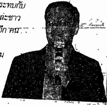
นายอภิสิทธิ์ เวชชาชีวะ หัวหน้าพรรคประชาธิปัตย์

“อย่าทำอะไรให้กระทบกับ ความเชื่อมั่นที่ชาวไทยและชาว โลกมี. เพราะถ้าเลื่อนไปอีก คน ที่เสียหายที่สุด คือผู้ มีอำนาจ เพราะขาดความ น่าเชื่อถือและความเชื่อ มั่น ไม่สามารถเดิน หน้าตามสิ่งที่ตัวเองได้ ประกาศไว้”.