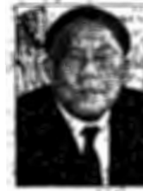
ขวัญเมือง

■...มีเรื่องดี ๆ ส่งท้ายปีเก่าต้อนรับปีใหม่ 2552 จากผู้ว่าฯ กทม. "พล.ต.อ.อัศวิน ขวัญเมือง" ถึงน้องๆคนไหนที่อยากใช้เวลาว่างให้เป็นประโยชน์ กับการหาความรู้ใหม่ๆ ที่ไม่มีสอนในโรงเรียน...คุณตาคุณยายท่านใด ที่เมื่อกับการต้องอยู่เหงาๆที่บ้านเวลาที่ลูกหลานออกไปทำงานกันหมด หรือใครก็ตาม ที่อยากเพิ่มเติมทักษะด้านต่างๆให้ตัวเอง...ผู้ว่าฯอัศวิน ขอแนะนำ "ศูนย์สร้างสุขทุกวัย" กรุงเทพมหานคร... "สำหรับทุกเพศทุกวัย ไม่ว่าท่านจะเป็นใคร เพียงสมัครเป็นสมาชิกของศูนย์ฯ ก็สามารถเข้าทำกิจกรรมต่างๆได้ฟรี อีกทั้ง ยังสามารถลงทะเบียนพัฒนาทักษะด้านต่างๆได้แบบฟรีๆ อีกด้วย..." ...ในการสมัครก็ง่าย ๆ สมาชิกค่าธรรมเนียมแค่...บัตรประจำตัวประชาชน รูปถ่ายขนาด 1-2 นิ้ว 2 รูป และเงินค่าสมัครสมาชิก โดย เด็กอายุ 7-17 ปี ค่าสมัคร 10 บาทต่อปี เยาวชนอายุ 18-24 ปี ค่าสมัคร 20 บาทต่อปี ประชาชน อายุ 25 ปีขึ้นไป ค่าสมัคร 40 บาทต่อปี เป็นสมาชิกแล้วก็เริ่มเรียนฟรีได้เลย!!!!...สนใจพัฒนาทักษะเพิ่มเติม ค่าเรียนไม่แพง ไม่ยื่นสมัครกันได้นะพ่อแม่พี่น้อง...■