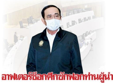
อาฟเตอร์ช็อกศึกชกฟอกท่านผู้นำ

มองข้ามช็อตไปเลยสำหรับภาพเหตุการณ์อนาคต หรือ "ซีเนริโอ" (Scenario) ที่คนไทยทั้งประเทศจะได้เห็นเต็มสองตา ภายหลั่งลมตีไม่ไว้วางใจ วันที่ 4 ก.ย. จะเกิด "อาฟเตอร์ช็อก" 2 เรื่องสำคัญ