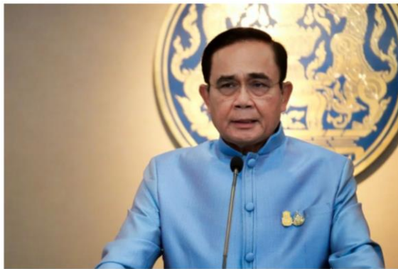
พล.อ.ประยุทธ์ จันทร์โอชา นายกรัฐมนตรีและ-รมว.กลาโหม กล่าวถึงการเลือกตั้งผู้ว่าราชการ

พล.อ.ประยุทธ์ จันทร์โอชา นายกรัฐมนตรีและ รมว.กลาโหม กล่าวถึงการเลือกตั้งผู้ว่าราชการกรุงเทพมหานครว่า รัฐบาลยังไม่ตัดสินใจว่าจะให้มีการเลือกตั้งผู้ว่า กทม.ในลำดับแรก โดยอาจพิจารณาจัดให้มีการเลือกตั้งในระดับ องค์การบริหารส่วนจังหวัด (อบจ.) ก่อน