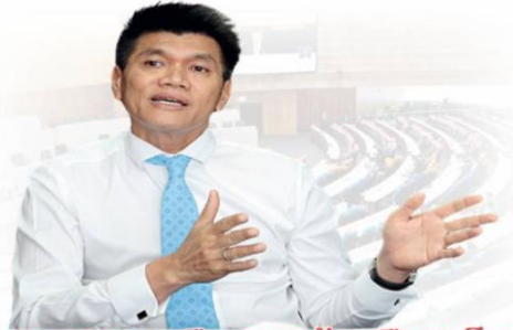
ยุบสภาธ.ค. เขื่อกสุดท้ายเรือเหล็ก

“สถานการณ์นี้ต้องทำเพื่อประเทศชาติ เรื่องสืบทอดอำนาจพักไว้ โดยการแสดงออกว่าไม่ได้ต้องการสืบทอดอำนาจ เช่น การแก้ไขรัฐธรรมนูญ”