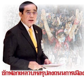
ชักฟอกเหลวบทสรุปลงถนนการเมือง

ปิดจ๊อบเกมการเมืองกับการอภิปรายไม่ไว้วางใจรัฐมนตรีเป็นรายบุคคล ให้พ่นน้ำลายกันร่วม 60 ชั่วโมงเนิ่นนานกว่า 5 วัน ตั้งแต่วันที่ 31 ส.ค. จนกระทั่ง 4 ก.ย.ที่ผ่านมา ท้ายที่สุด “บิ๊กตู” พล.อ.ประยุทธ์ จันทร์โอชา นายกรัฐมนตรีและรมว.กลาโหม และรัฐมนตรีอีก 5 คน ก็ได้รับเสียงข้างมากไว้วางใจจากสภาตามระเบียบ โดย 1. พล.อ.ประยุทธ์ ไว้วางใจ 264 เสียง ไม่ไว้วางใจ 208 เสียง งดออกเสียง 3 เสียง นายอนุทิน ชาญวีรกูล รองนายกรัฐมนตรี และรมว.สาธารณสุข ไว้วางใจ 269 เสียง ไม่ไว้วางใจ 196 เสียง งดออกเสียง 11 เสียง