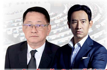
ผลประโยชน์ลงตัวของอภิปรายก็แค่ปาที

ที่ผ่านมาการทำงานของ 2 พรรคมีการคาใจกันกลายเป็นม ยังไม่ถึงศึกอภิปรายไม่ว่างใจที่จะยื่นในวันที่ 16 ส.ค.นี้ ก็ไม่รู้ว่า ศึกอภิปราย รอบ 3 พรรคเพื่อไทยจะมี เกี้ยเซี่ยะ หรือมีข้อสอบรั้ว หรือชกเต็ม 100 เปอร์เซนต์หรือไม่