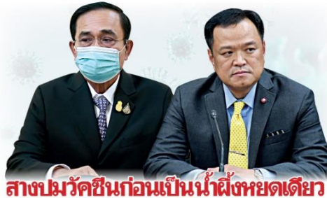
สาขปมวักซิ่นก่อนเป็นน้ำฝิ่งหยดเดียว

สภาพ “บึกตู่” ผู้นำประเทศ ก็สะบักสะบอมรายวัน ซึ่งรัฐบาลต้องตั้งสติดีๆ อย่างามามัวทะเลาะกับสื่อ เพราะปัญหาใหญ่วันนี้ทั่วโลกคือศัตรูตัวเดียวกัน “ไวรัสสมรณะโควิด”