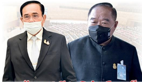
รอยร้าว 3 ป. สีนามีส่มเรือเหล็ก

งานนี้ใครๆ ก็ต่างจับตาสายสัมพันธ์ 3 ป. ระหว่างฟาก"บิ๊กตู-บิ๊กป้อม"และพีใหญ่"บิ๊กป้อม"ว่าจะเคลียร์ใจกันหมดเปลือกได้ตามภาพที่ทั้งเจ้าตัวและคนใกล้ชิดยืนยันว่าสัมพันธ์พี่น้อง 3 ป. ยังเหนียวแน่นไม่มีอะไรมากระทบกระเทือนหรือทำลายได้ ทั้งนี้เพราะคนทั่วไปต่างเชื่อว่าการล่าเส้นทุบโต๊ะปลดฟ้าผ่าของ"บิ๊กตู"ครั้งนี้ก็เหมือนเป็นการลูบคมพีใหญ่