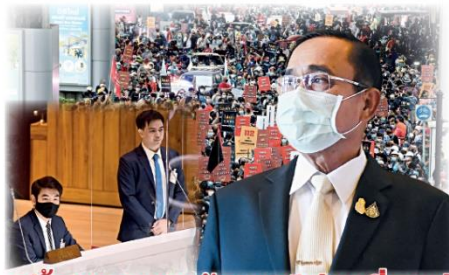
3 นัวยุเกม 3 ขารักสงบไม่จบที่'ลุงตุ๋'

การออกมาใช้กำปั้นทุบกวาดล้างเชื้อไฟม็อบที่ฟลุ่ฟลานด้วยวิธีการบังคับใช้กฎหมายมาจัดการนั้น ไม่ใช่ว่ากลุ่มม็อบเหล่านี้จะไม่เคยเจอ เพราะหนักกว่านี้ก็เจอมาแล้วหนักต่อนัก