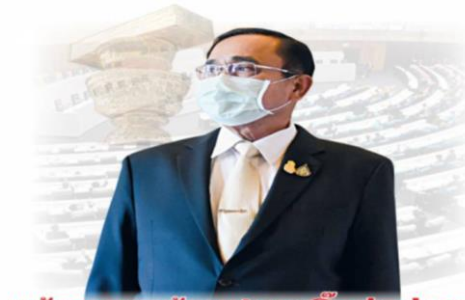
แก้ รธน. เกมร้อนปูทาง "บิ๊กตุ๋" อยู่ยาว

นับถอยหลังจากนี้ “ผู้นำประเทศ” พล.อ.ประยุทธ์ จันทร์โอชา นายกรัฐมนตรีและรมว.กลาโหม โชว์โรดแม็ปประกาศเปิดประเทศภายใน 120 วัน เพื่อรับนักท่องเที่ยวที่ฉีดวัคซีนครบโดสเรียบร้อยแล้ว เดินทางเข้าประเทศได้ โดยไม่ต้องกักตัว และไม่มีเงื่อนไขข้อห้ามที่สร้างความยากลำบาก ธุรกิจร้านค้า สถานที่ท่องเที่ยวต่างๆ กลับมาเปิดทำการเดินทางท่องเที่ยวภายในประเทศ กลับสู่โหมดภาวะปกติ คลายภาวะฉุกเฉินจากวิกฤติโรคระบาด