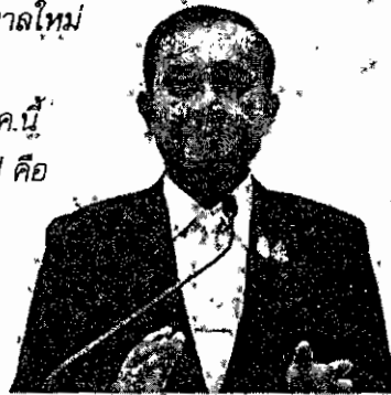
พล.อ.ประยุทธ์ จันทร์โอชา นายกรัฐมนตรีและหัวหน้า คสช.

“การจัดตั้งรัฐบาลใหม่ ผมยืนยันว่าจะแล้ว เสร็จภายในเดือน ก.ค.นี้ แน่นอนตามโรดแมป คือ พิธีเข้าเฝ้าฯ ถวาย สัตย์ปฏิญาณต่อ พระบาทสมเด็จพระเจ้าอยู่หัว ซึ่ง จะถือเป็นการ ทำงานของรัฐบาลโดยสมบูรณ์”