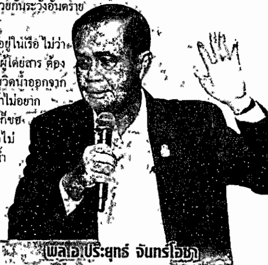
พล.อ.ประยุทธ์ จันทร์โอชา

"ทุกคนที่อยู่ในเรือ ไม่ว่าจะปัดน้ำฝน ถูกเรือหรือผู้โดยสาร ต้องร่วมมือร่วมใจ ช่วยวิดน้ำออกจากเรือ ขณะเดียวกันถ้าไม่ยกวิคิน่า วิคไม่เป็น ก็ชงอย่างเดียวเมื่อมือไม่พายอย่าเอาเท้าราน้ำ บูล้อยให้คนที่เขามีแรงพายเรือต่อไป ขอให้มันนิ่ง ๆ แล้วสาวคนดี เพราะถ้าเรือ