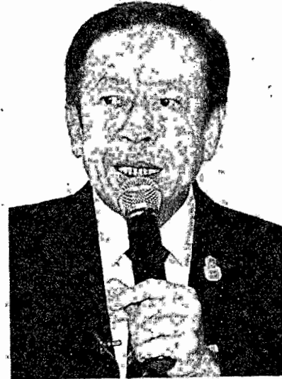
Jarungvitthi: Cheats face bans

Already, the commission has announced it will recount ballots in at least two constituencies, and organise election reruns in at least six others, including one in Bangkok.