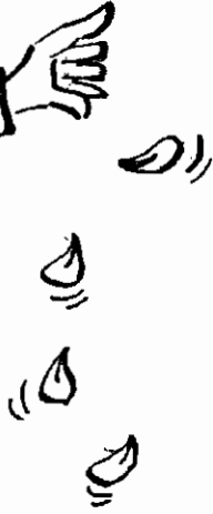
ถวายสัตย์ฯไม่ครบ นายฯกำลังหาวิธีแก้ปัญหายุ่งครึบ