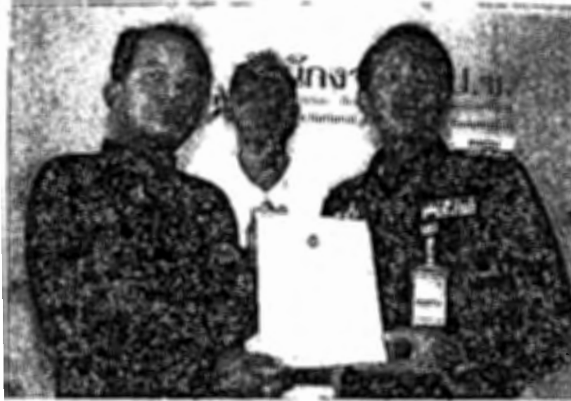
เพอขอให้ตรวจสอบกรณี ส.พรรคินคาร์ วานิช ส.ส.บัญญัติรายชื่อ พรรคอนาคตใหม่ จากกรณี โฟสต์ข้อความและภาพเกี่ยวกับสถาบัน ซึ่งกระทบต่อมาตรฐานทางจริยธรรมอย่างร้ายแรง