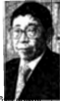
ปิยบุตร แสงกนกกุล วิชญ์ เกรืองาม

ขอตะกร้อครอบปากสามมิตร ล่าสุด ธนกร โพลด์ระบุนไม่ตอบโต้ แต่ยกคำพระ 'การยกโทษ-อภัยทาน' พร้อมติดแฮชแท็กประเทศชาติและประชาชนต้องมาก่อน... ● ปิยบุตร แสงกนกกุล เลขาธิการพรรคอนาคตใหม่ออกมาจุดพลุ ชงแก้รัฐธรรมนูญ 2 มาตราทั้ง 272 และ 279 แต่ถูกส.ว. แต่งตั้งถอดมาค้านทันที วิชญ์ เกรืองาม รองนายกฯ แจงนิมๆ เป็นสิทธิ์ส.ส. ยื่นแก้ได้ รวมถึงประชาชน 5 หมื่นชื่อก็เข้าชื่อขอแก้ไขได้ แต่ต้องนำเข้าไปประชุมร่วมส.ส.-ส.ว. ทั้ง 3 วาระ ที่สำคัญคะแนนโหวตแต่ละวาระคงผ่านยาก เพราะการได้เสียงเกินกึ่งหนึ่งของทั้ง 2 สภาวมกันยังไม่พอ เพราะต้องได้คะแนนเสียงจากส.ว. อย่างน้อย 86 คนด้วย... ● ถูกจับตาดูถึงการทำหน้าที่มาตลอดสำหรับ กกต. ที่เรื่องร้องเรียนเกี่ยวกับพรรคของฝ่ายผู้มีอำนาจมักอืดเป็นเรื้อเรื้อ ทั้งคดีโต๊ะจีนระดมทุนของพลังประชาชน หรือเรื่อง 41 ส.ส. ถือนุ้สื้อ ขณะที่ยกฝ่าย การพิจารณากลับรวดเร็วทันใจ ล่าสุด อิทธิพร บุญประครอง ประธาน กกต. เผยเบื้องต้นสำนักงานกกต. รับสอบปมชื่อ 'งูเห่า' อนาคตใหม่ 120 ล้านตามที่ 'ศรีสุวรรณ จรรยา' ยื่นร้องให้แสดงหลักฐานเพราะโทษถึงยุบพรรคเมื่อสืบพาดำก่อน ตอนนี้อยู่ในขั้นรวบรวมข้อมูลก่อนส่งกกต. ชุดใหญ่... ●