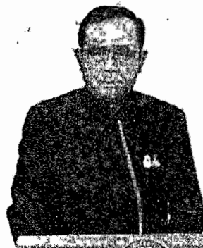
พล.อ.ประยุทธ์ จันทร์โอชา นายกรัฐมนตรี

“ผมขอยืนยัน ว่าจะทุ่มเททำงาน ตามมาตรฐาน จริยธรรมด้วยความ ซื่อสัตย์สุจริต โดย ยึดถือผลประโยชน์ ของประเทศชาติและ ประชาชนเป็นสำคัญ จะเพียรพยายามมุ่ง มั่นทำงาน พร้อมเปิดรับฟังความคิดเห็นของทุกกลุ่ม ทุกฝ่าย”