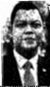
อนุทิน ชาญวีรกูล รมท. รังบุญคงชนะ

นายกฯ พรรคถึงจะเคาะชื่อบุคคลที่จะนั่งรัฐมนตรี พร้อมยกธรรมเนียมปฏิบัติของทุกรัฐบาลที่ผ่านมา รวมถึงตอนที่ประชาธิปัตย์เป็นแกนตั้งรัฐบาล เมื่อพรรคร่วมส่งชื่อมาให้นายกฯพิจารณา ก็ไม่เคยเปลี่ยนแปลงรายชื่อ หรือชื่อใดกรรม ของพรรคร่วม... ● ออกมาเปิดศึกวิวาทะผ่านโซเชียลจนร้อนฉ่า ระหว่างเสี่ยหนู-อนุทิน ชาญวีรกูล หัวหน้าพรรคภูมิใจไทย กับ ธนกร รังบุญคงชนะ รองโฆษกพลังประชาชน ถึงการจัดสรรโควตากระทรวงต่างๆ ได้กันแรงขนาด