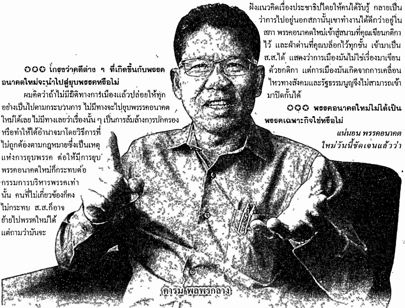
คารม พลพรรคกลาง

กรรมการบริหารพรรคเท่านั้น คนที่ไม่เกี่ยวข้องก็คง ไม่กระทบ ส.ส.ก็อาจ ย้ายไปพรรคใหม่ได้ แต่ถามว่ามันจะ