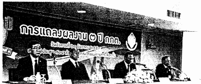
มั่นคง ตรงไป ตรงมา แนวหน้า