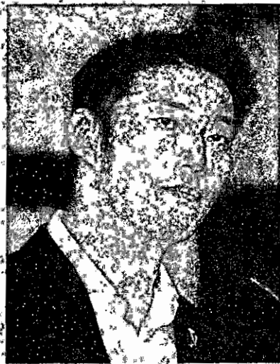
Thanathorn: Urged to get out more

staging the Asean summit at the five star Athenée Hotel.