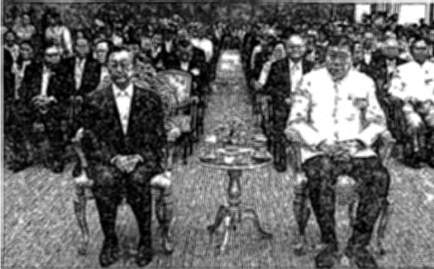
87 ปีรัฐสภา : นายชวน หลีกภัย ประธานรัฐสภา เป็นประธานในพิธีทำบุญเนื่องในวันสถาปนารัฐสภา ครบรอบ 87 ปี โดยมีนายพรเพชร จีดิชชชัย ประธานวุฒิสภา พรองประธานทั้ง 2 สภา รวมถึงคณะผู้บริหาร และเจ้าหน้าที่รัฐสภา ร่วมในพิธี ณ อาคารรัฐสภา เกียกกาย วานนี้(28 มิ.ย.)