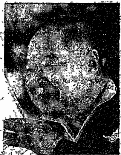
Prawit: Enjoys giving back land

their lack of political neutrality, it called on the Administrative Court to scrap the NCPD's order, seek a Constitutional Court ruling on whether the appointment of senators is constitutional, and urged the regime to set up a politically neutral selection panel.