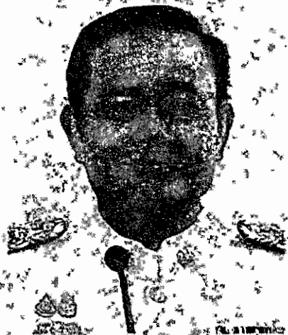
Prayut: Under fire over Senate process

The Senate selection by the National Council for Peace and Order (NCPO) is an issue that will not go away easily, according to political observers, even though one of the petitions challenging the legitimacy of the